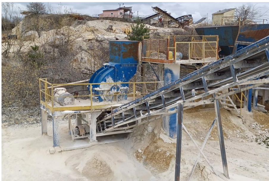
Fot. 5 Kruszarzka młotkowa 44.12 oraz przenośnik taśmowy na przesiewacz