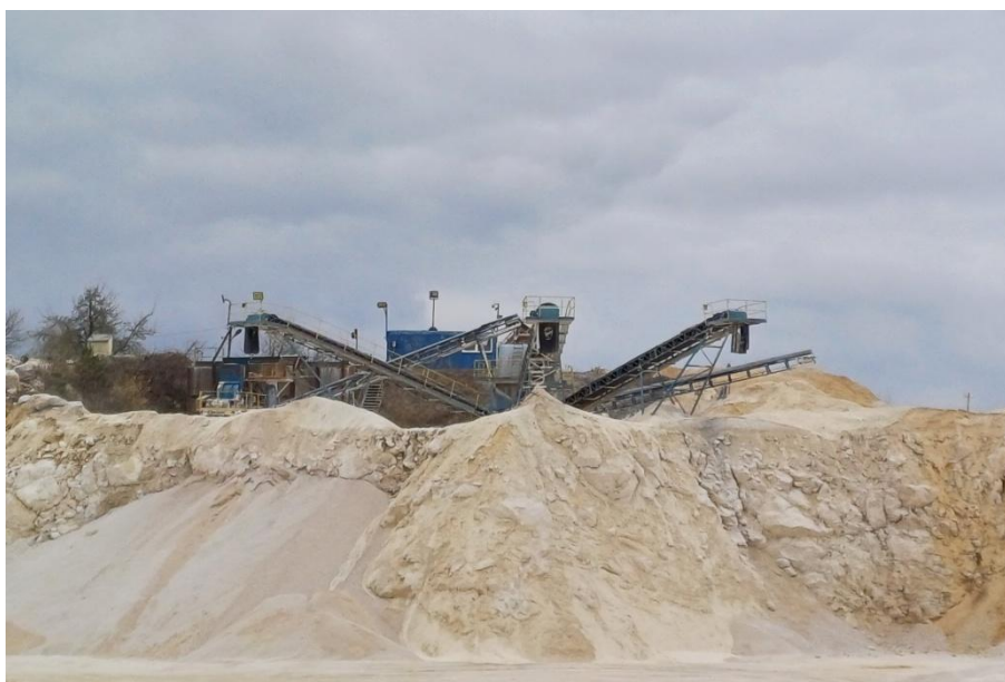
Fot. 1 Ogólny widok zakładu przeróbczego

CENA SPRZEDAŻY: 370 000 zł + 23% VAT (DO NEGOCJACJI)