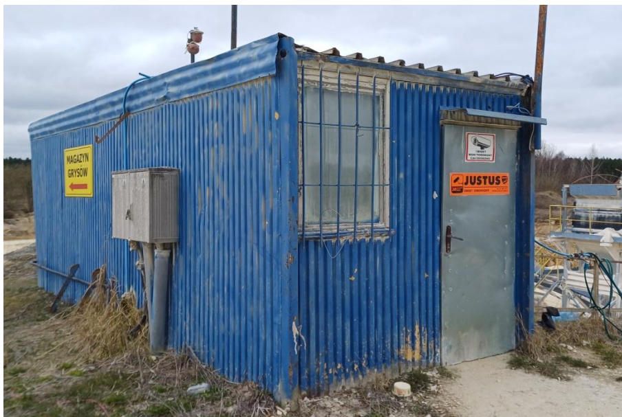
Fot. 2 Budynek sterowni