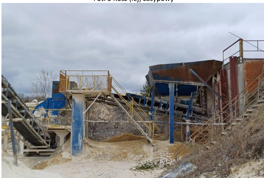
Fot. 4 Kosz zasypowy, przenośnik członowo – płytowo – taśmowy i kruszarka młotkowa 44.12